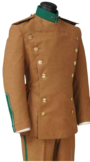
楯の会制服(冬服) 1968年頃 一宮市博物館蔵「日・墨コレクション」