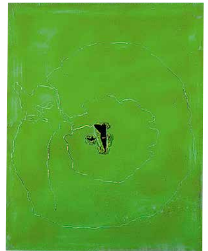
ルーチョ・フォンタナ 空間概念 1962年