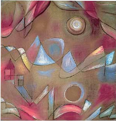
パウル・クレイ 北極の露 1920年