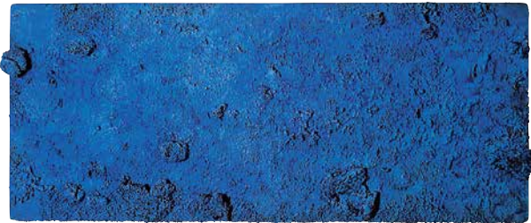
イヴ・クライン 海綿レリーフ (RE50) 1958年