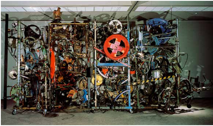
ジャン・ティンゲリー 地獄の首都 No.1 1984年